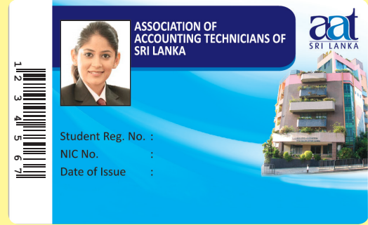
(AAT மாணவர் அடையாள அட்டை மாதிரி உருவம்)

மாணவர்கள் தமது முழுமையான கையொப்பத்தினையும் சுருக்கக்கையொப்பத்தினையும் வேறாகும் வகையில் தெளிவாகப் பயன்படுத்த வேண்டுமென்ப பொதுவாக எதிர்பார்க்கப்படுகின்றது.